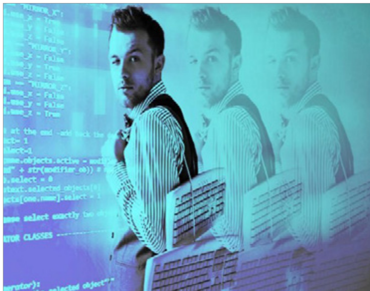
مهارت‌های روز دنیای فناوری